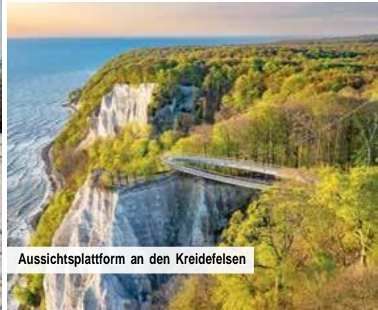
Aussichtsplattform an den Kreidefelsen