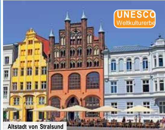
Altstadt von Stralsund