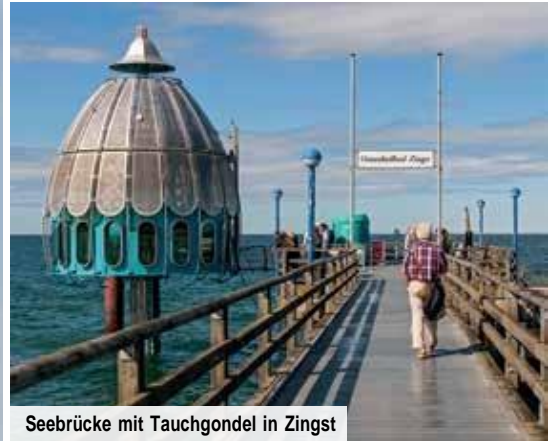
Seebrücke mit Tauchgondel in Zingst