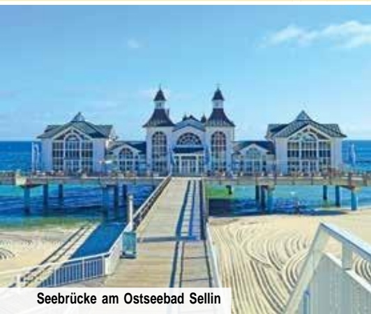
Seebrücke am Ostseebad Sellin

Kap Arkona und sehen im Nationalpark Königsstuhl die berühmten Kreidefelsen, die schon Caspar David Friedrich verewigte. Sie besichtigen die stolze Hansestadt Stralsund und fahren mit einer Kutsche durch die Naturidylle der Insel Hiddensee. Diese einzigartige Reise, ehemals „Inselhüpfen