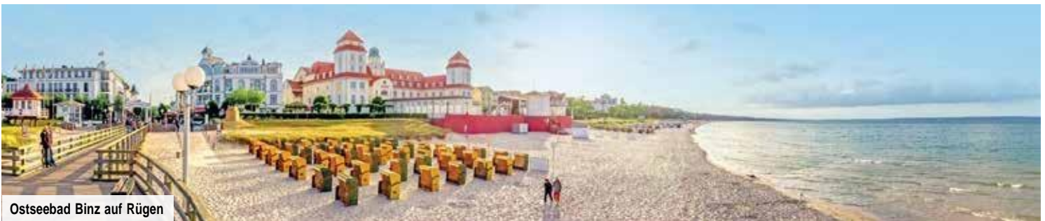
Ostseebad Binz auf Rügen

nur mit zeitlich befristetem Aktions-Code