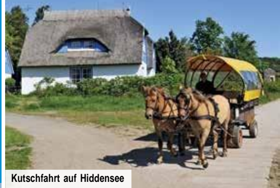
Kutschfahrt auf Hiddensee