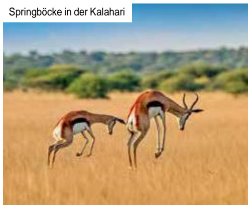
Springböcke in der Kalahari

Kalahari-Wüste bewundern. Gelbes Gras und dunkelgrüne Akazien vor orangefarbenen Sandgebirgen und dem Blau des unendlichen Himmels – einfach umwerfend. In der Zeit zwischen Tag und Traum, wenn allmählich die Sonne am Horizont versinkt, gehen Sie auf Foto-Safari. Bei Ihrer Sonnenuntergangsfahrt mit Drinks und Snacks in den roten Dünen der Kalahari kommen Sie der atemberaubenden Natur ganz nah. Springböcke, Strauße, Schakale, Riestrappen – spüren Sie die Magie der Wüste und lassen Sie beim Abendessen in der Lodge diesen Tag voller überwältigender Panoramen entspannt ausklingen.