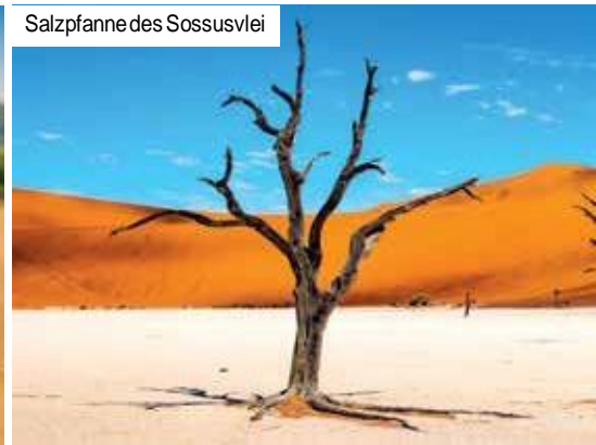
Salzpfanne des Sossusvlei

Ihre Reise geht weiter gen Westen mit einem Stopp in Maltahöhe. Der kleine Ort mit rund 2.500 Einwohnern liegt inmitten von Schaf- und Straußenfarmen und ist die letzte größere Siedlung auf Ihrem Weg zum Tsaris-Hoogte-Pass. Von der Hochebene mit den malerischen Tsarisbergen im Hintergrund steigt die rote Wüstenpiste hinunter in die zentrale