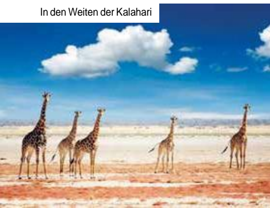
In den Weiten der Kalahari

Das Fort beherbergt das Nationalmuseum von Namibia. Nach Ihrer ausgiebigen Rundfahrt geht es zum Check-in in Ihr Hotel Avani Windhoek. Am Abend genießen Sie ein Welcome-Dinner der besonderen Art in den legendären Restaurants Joe's Beerhouse (klassische Gruppe) oder Leo's Garden (Kleingruppe). Sie erwartet ein unvergessliches Begrüßungssessen mit deutschem Bier und kulinarischen Spezialitäten des Landes.