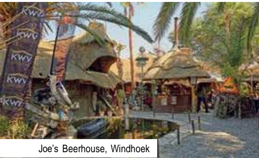
Joe's Beerhouse, Windhoek