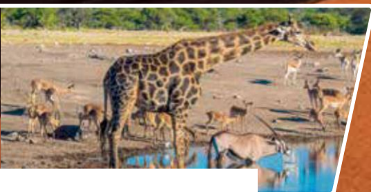
Artenvielfalt im Etosha-Nationalpark