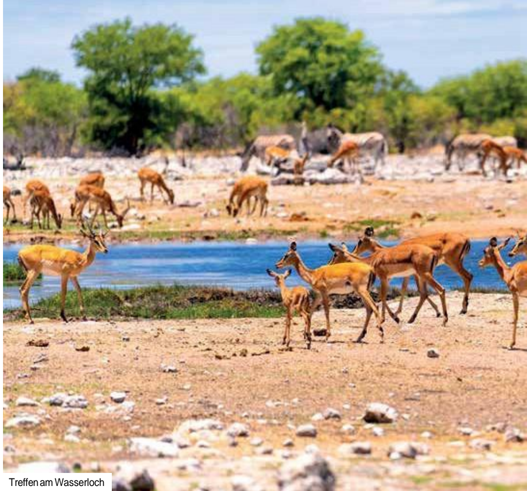
Treffen am Wasserloch