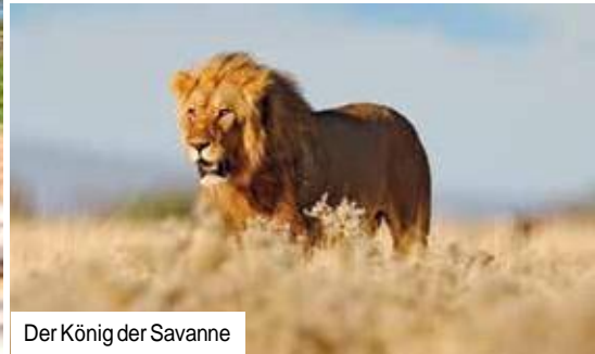
Der König der Savanne

gender Artenreichtum, darunter vier der „Big Five“: Elefant, Nashorn, Löwe und Leopard fühlen sich hier daheim. Welche Tiere Sie bei Ihrer ganztägigen Pirschfahrt im Reisebus sichten, hängt von der Jahres- und Tageszeit ab. Doch die rund 75 Wasserstellen im Park und die weiten Ebenen, über die der Blick ungehindert schweift, versprechen eine Vielzahl von bewegenden Begegnungen mit den atemberaubenden Geschöpfen der Wildnis! Sowohl einige der häufigsten als auch einige der seltensten Tierarten leben im Etosha-Nationalpark. Der dichter bewachsene Teil des Geländes ist das Zuhause von Elefanten und den vom Aussterben bedrohten Spitzmaulnashörnern und Leoparden. Löwen sind gut im goldgelben Gras getarnt, während Giraffen elegant und gut erkennbar durch die trockene Vegetation schreiten. Vogelbeobachter werden die Regenzeit in Etosha lieben. Nach starken Niederschlägen zieht die mit Wasser gefüllte Pfanne eine Schar von rosa Flamingos an. Der Park ist auch die Heimat des weltweit größten Vogels, dem Strauß, und des schwersten fliegenden Vogels, der Riesentrappe. Auch zehntausende Springböcke,