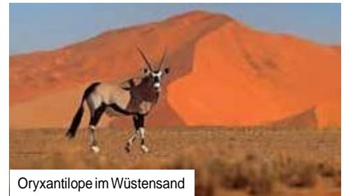
Oryxantilope im Wüstensand