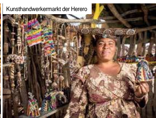
Kunsthandwerkmarkt der Herero