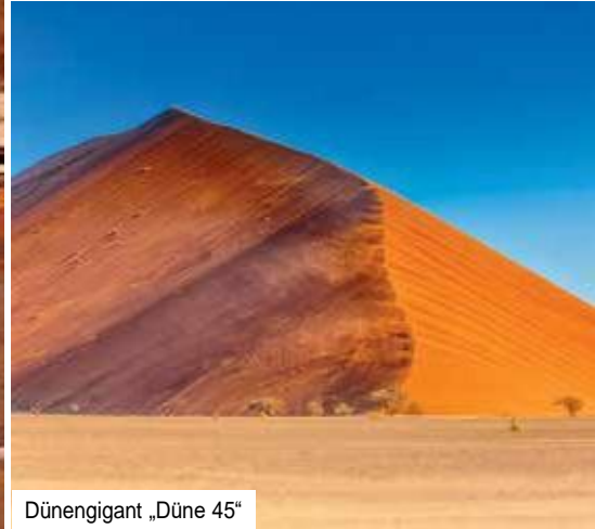
Dünengigant „Düne 45“

Namib-Wüste – eine spektakuläre Abfahrt. Namib bedeutet so viel wie „große Leere“ und tatsächlich gibt es hier, anders als in der Halbwüste Kalahari, kaum Pfl. Sie reisen von Wüste zu Wüste und lernen zwei absolut faszinierende, jedoch überraschend unterschiedliche Lebensräume kennen. Auch die Namib selbst, die sich 1.300 km weit entlang der Atlantikküste erstreckt, teilt sich in zwei landschaftlich sehr gegensätzliche Regionen: Im Norden liegen schroffe Felsen und Schluchten, im Süden breitet sich ein Meer von rötlichen Dünen aus. Auf Ihrer Reise werden Sie dieses Naturwunder in seinem ganzen Facettenreichtum erleben! Am Nachmittag erreichen Sie Ihre Lodge in der Nähe von Sesriem, in der Sie zweimal übernachten und gemütlich zu Abend essen.