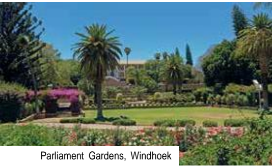
Parliament Gardens, Windhoek