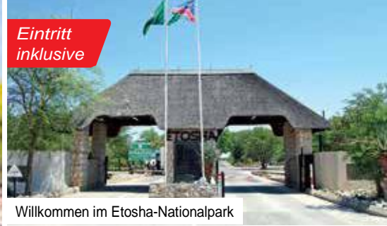
Willkommen im Etosha-Nationalpark