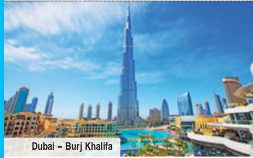
Dubai – Burj Khalifa