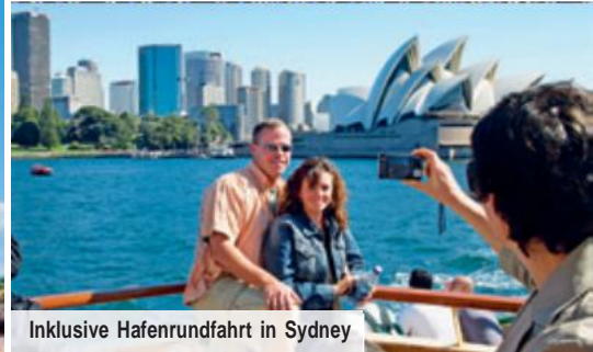
Inklusive Hafenrundfahrt in Sydney