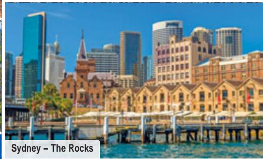
Sydney – The Rocks