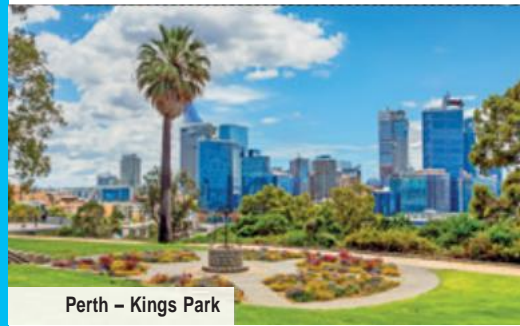
Perth – Kings Park