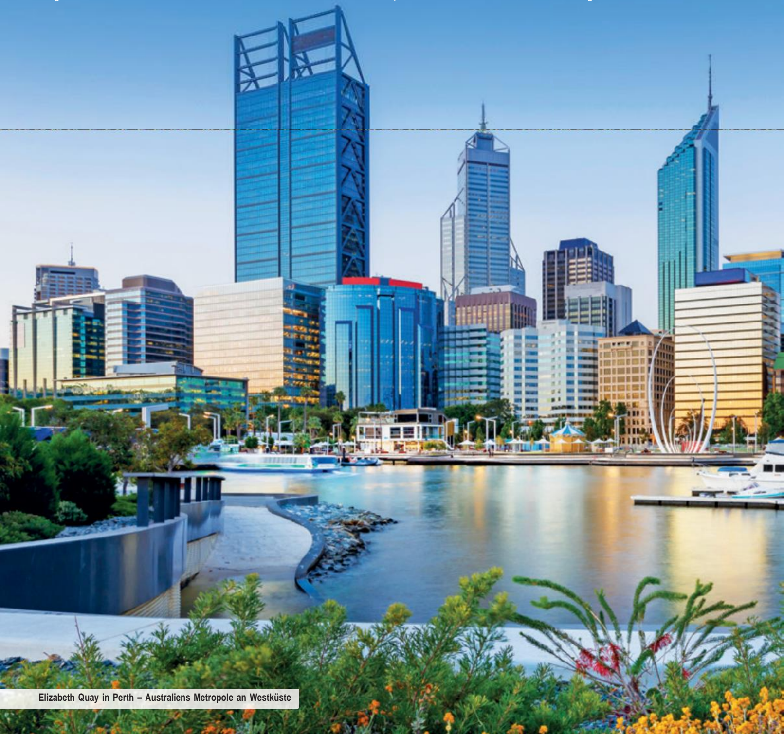
Elizabeth Quay in Perth – Australiens Metropole an Westküste

von dort aus zum Ayers Rock und vom Roten Zentrum zu guter Letzt nach Sydney. Sie nächtigen durchweg in guten Hotels und dürfen sich als exklusives trendtours -Highlight auf einen Workshop in traditioneller Aboriginals-Malerei freuen. Greifen Sie jetzt zu und sichern Sie sich unsere spektakuläre Reiseneuheit, bevor Sie ausgebucht ist!