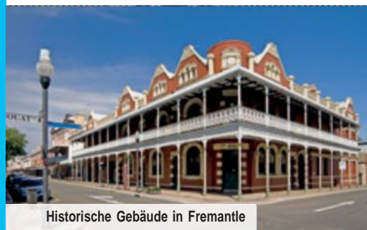
Historische Gebäude in Fremantle