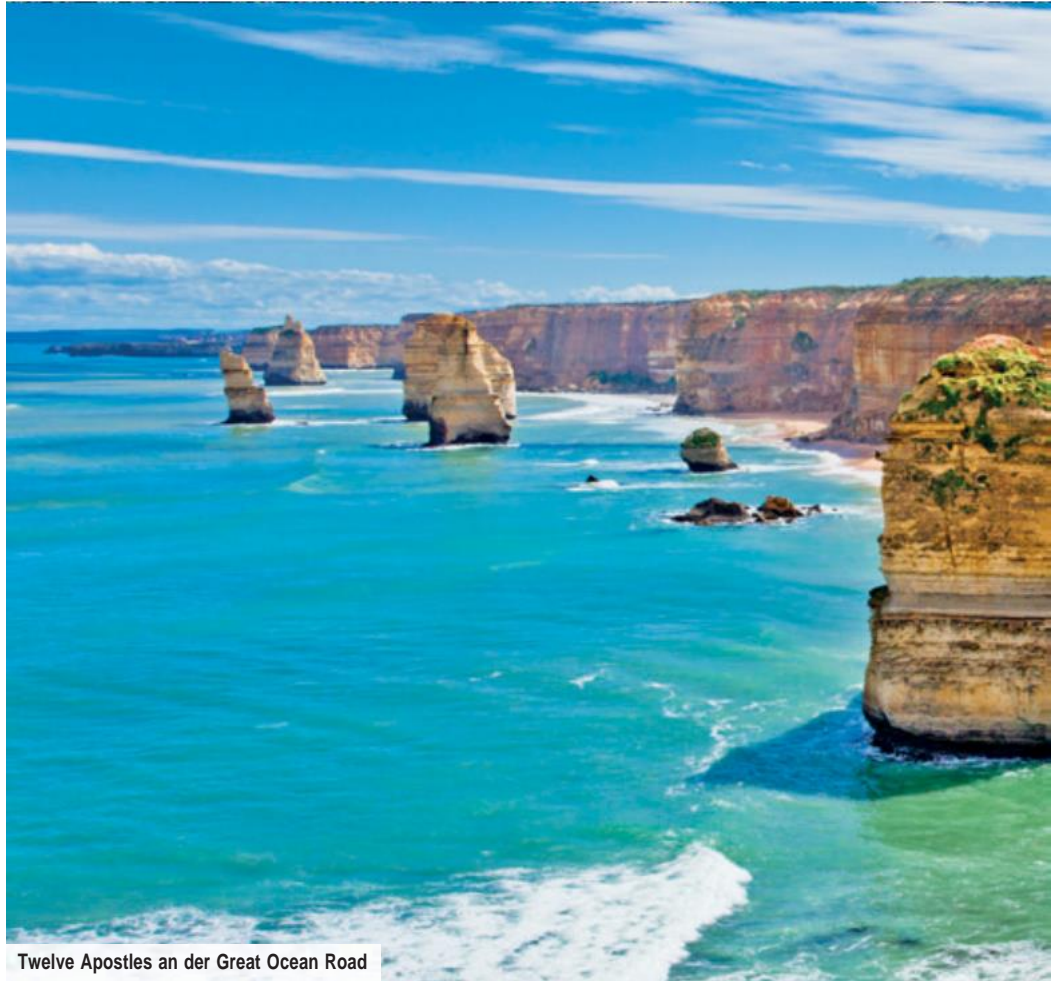
Twelve Apostles an der Great Ocean Road